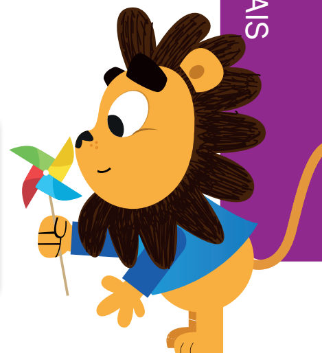
Ilustrações de Júnior Caraméz, do livro Léo e o cata-vento .